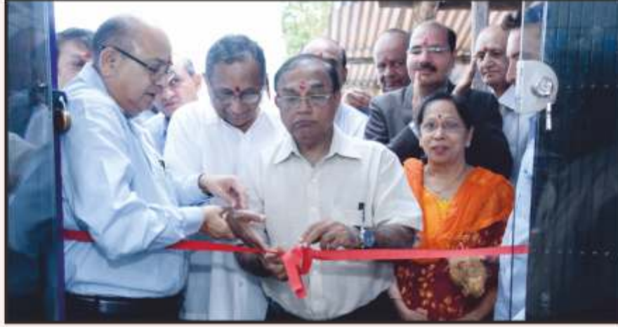
બેન્કની સલાબતપુરા શાખાનું ઉદ્ઘાટન કરતા બેન્કના માજી પ્રમુખશ્રી, પ્રમુખશ્રી, મેનેજિંગ ડિરેક્ટરશ્રી, સાથી ડિરેક્ટરશ્રીઓ તથા બેન્કના વહીવટી અધિકારીઓ.