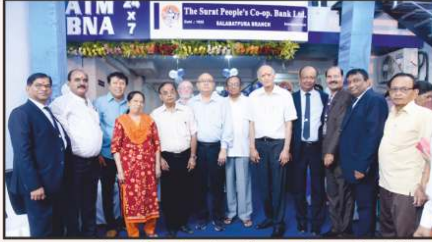
બેન્કની સલાબતપુરા શાખાનો નવા પરિસરમાં શુભારંભ પ્રસંગે હાજર રહેલ પ્રમુખશ્રી, સાથી ડિરેક્ટરશ્રીઓ તથા બેન્કના વહીવટી અધિકારીઓ.