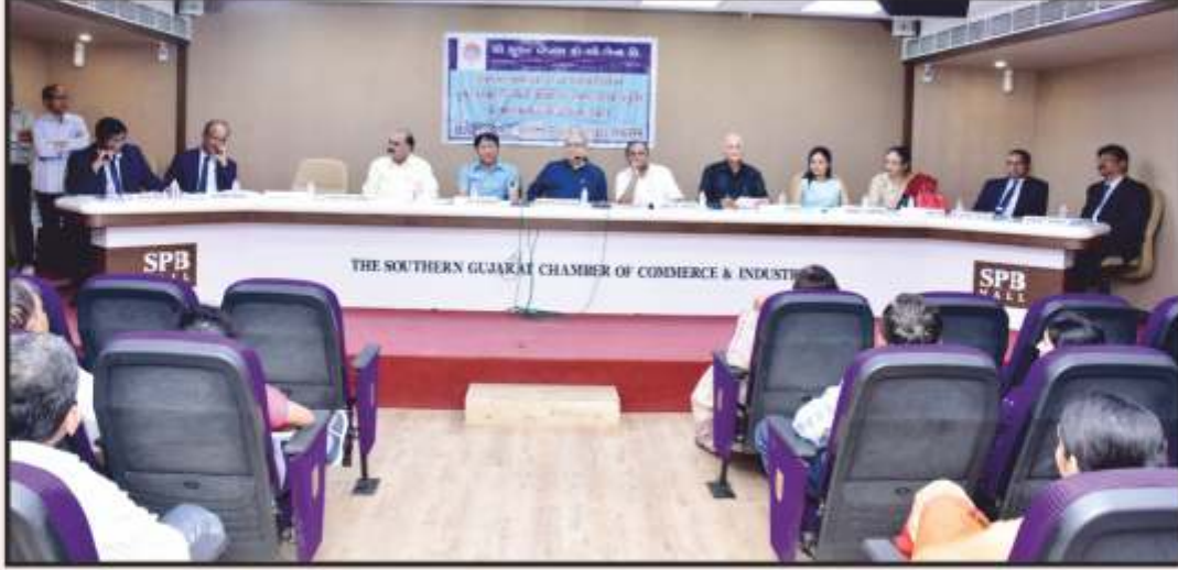
આ પ્રસંગે ઉપસ્થિત પ્રમુખશ્રી, સાથી ડિરેક્ટરશ્રીઓ અને બેન્કના ઉચ્ચ અધિકારીઓ.