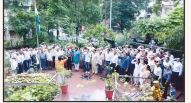
રાષ્ટ્રીય પર્વ ગણતંત્રદિને તેમજ સ્વતંત્રતા દિને રાષ્ટ્રધ્વજને સલામી અર્પણ કરતા પીપલ્સ બેન્ક પરિવારના સભ્યો