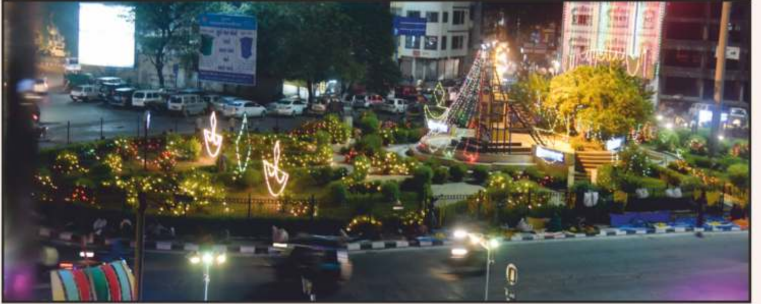
દિવાળીના પર્વે સુશોભિત બેન્ક પુરસ્કૃત સ્વામી વિવેકાનંદ આઈલેન્ડની શોભા.